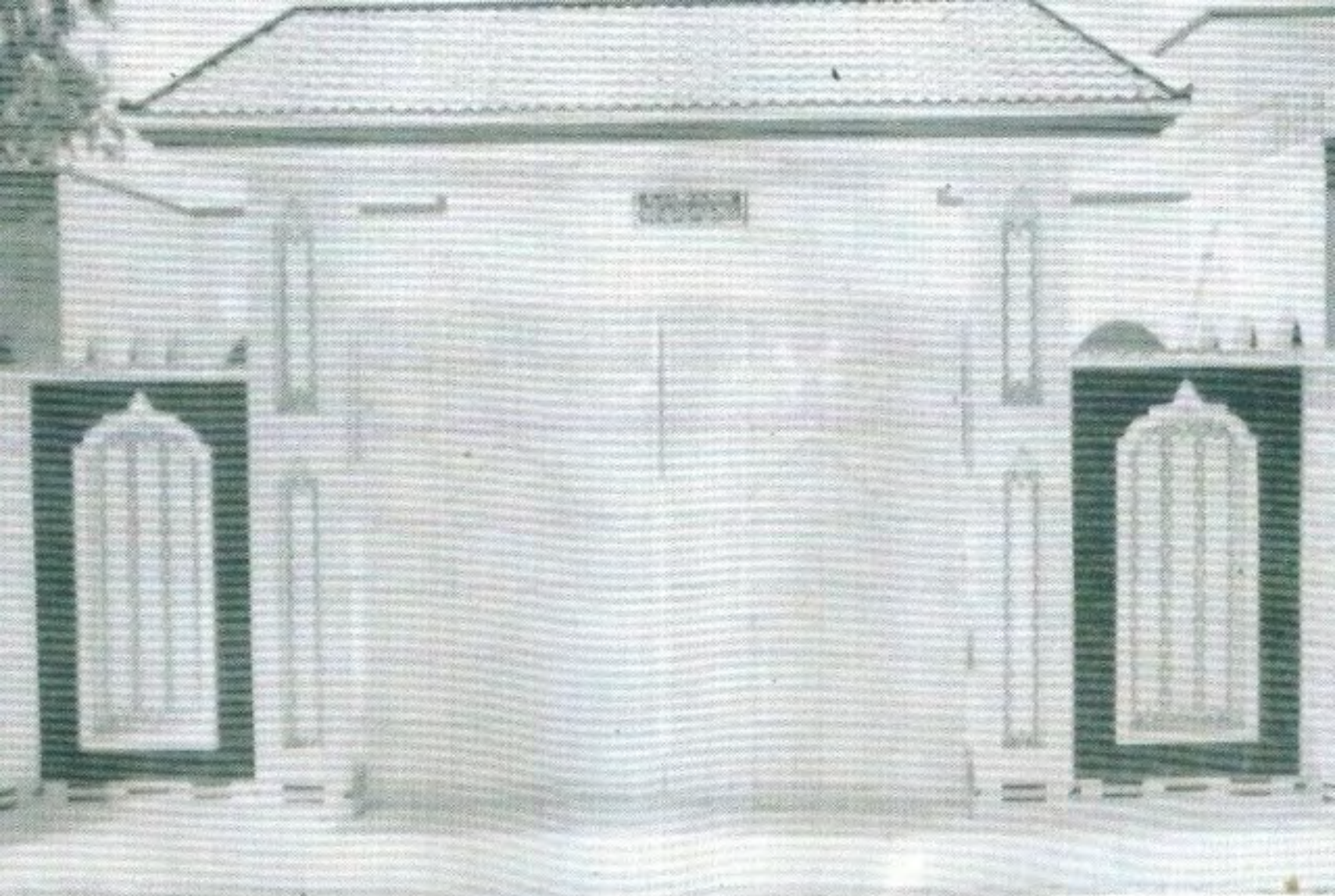
جامعہ مجددیہ دارالارشاد (نئیں بلڈنگ) جو خوبصورت مین گیت